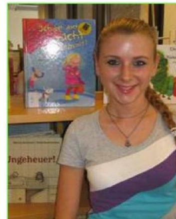
Jessica Hildmann Medien- und Informationsdienste Kinderbücherei