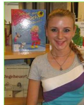
Jessica Hildmann Medien- und Informationsdienste Kinderbücherei