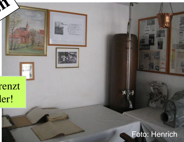
Lorem ipsum dolor sit amet,

Anzahl der Seiten unbegrenzt Quellenangabe der Bilder!