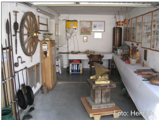
sed diam nonumy eirmod