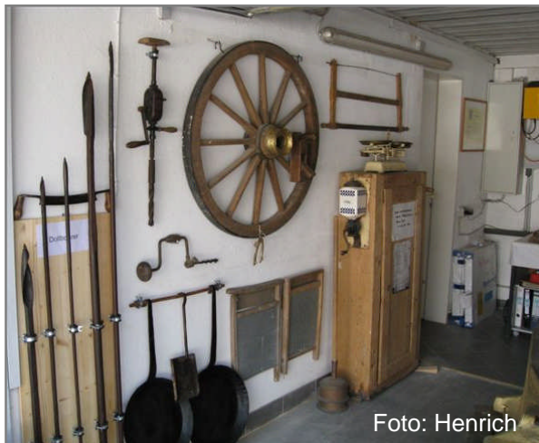
consetetur sadipscing elitr,