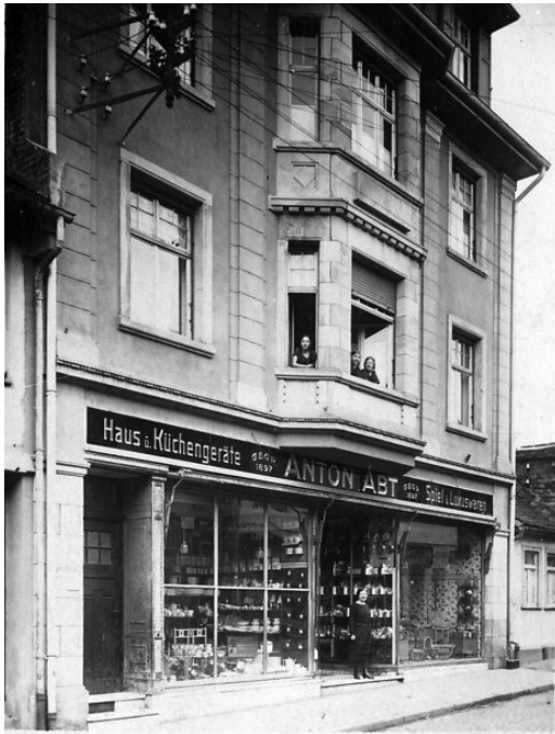
Das Wohn- und Geschäftshaus der Familie Kahn-Mannheimer in der Unteren Hainstraße 22 (später »Kaufhaus Franke«). Einige Häuser unterhalb war das Hauptquartier der Oberurseler SS-Staffel und dem gegenüber das Bekleidungshaus der jüdischen Familie Unger-Schwarzchild (siehe »Mitteilungen« 40/2000)