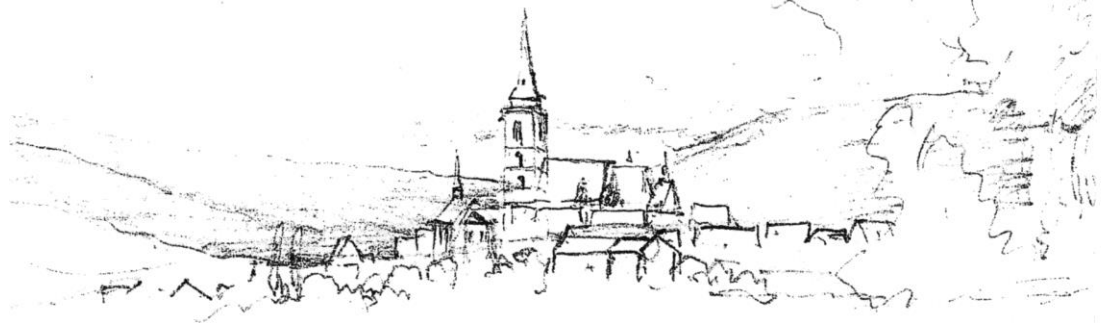
Oberursel, aus dem Skizzenbuch des Malers Eduard Wilhelm Pose *1812 Düsseldorf +1878 Frankfurt am Main