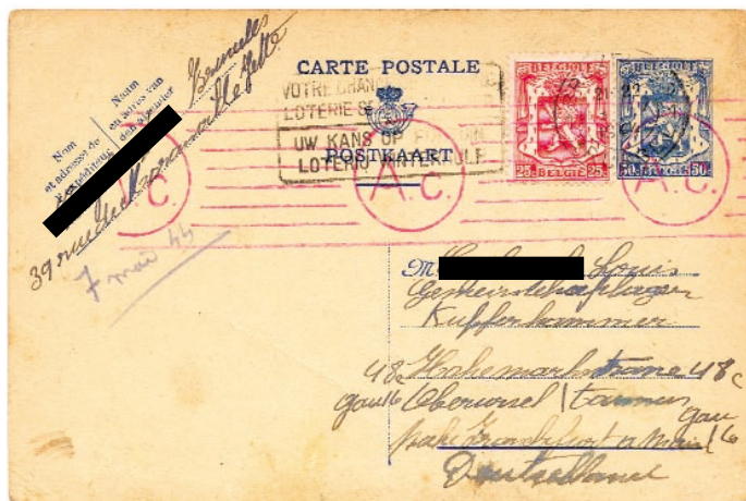
Postkarte aus Brüssel vom 18. 4. 1944