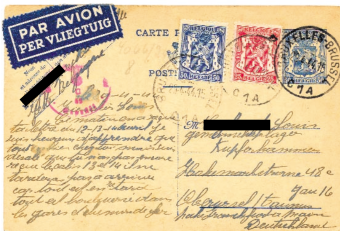
Postkarte aus Brüssel vom 20. 4. 1944

»Gestern ein Alarm, heute noch nichts ... man macht sich hier auf Ereignisse bereit, die sehr bald geschehen sollen, viele Leute in der Nähe der Bahnhöfe, Bahnlinien und Werke sollen evakuiert werden ... doch lassen wir uns nicht gehen, es muss doch zu einem Ende kommen und ich glaube, dass das Ende naht 30 .. bald wirst Du zu Hause sein ... uns geht es hier gut, wir haben einen kleinen Vorratskeller und haben auch noch Wasser, also mach dir keine Sorgen, wir haben Vorräte für mehrere Tage im Keller«.