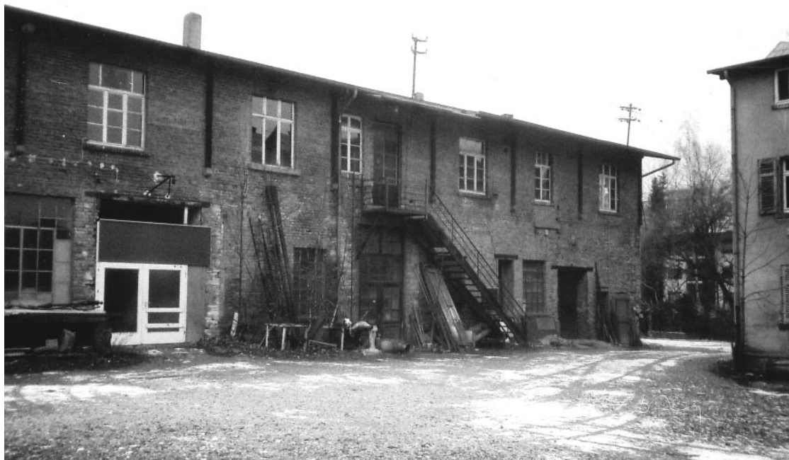
Fabrikgebäude des ehemaligen Rempel'schen Kupferhammers, rechts Wohnhaus