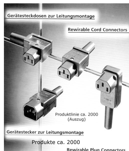
Produktlinie ca. 2000 (Auszug)