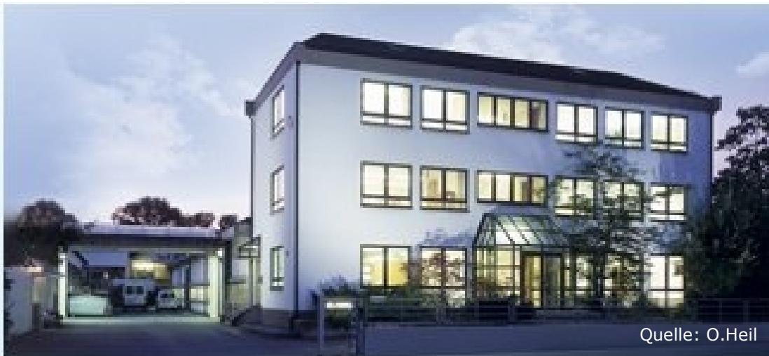
Fabrik Berlinerstraße/Freiligrathstraße 1951