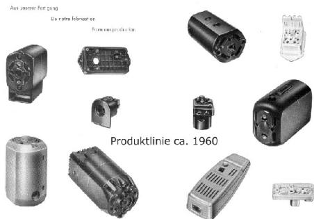
Produktlinie ca. 1960