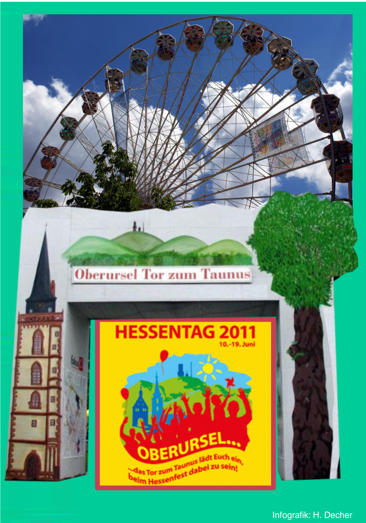
Infografik: H. Decher