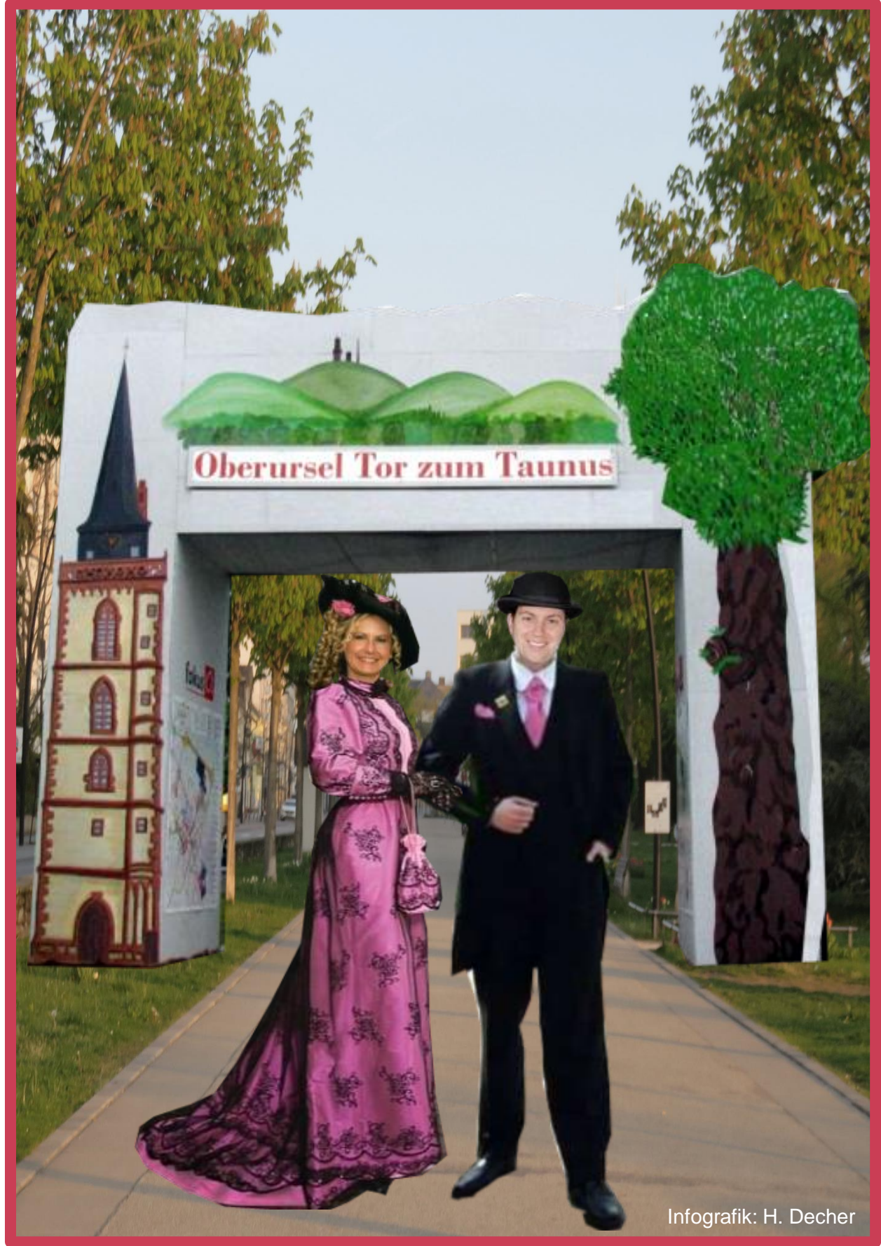
Infografik: H. Decher