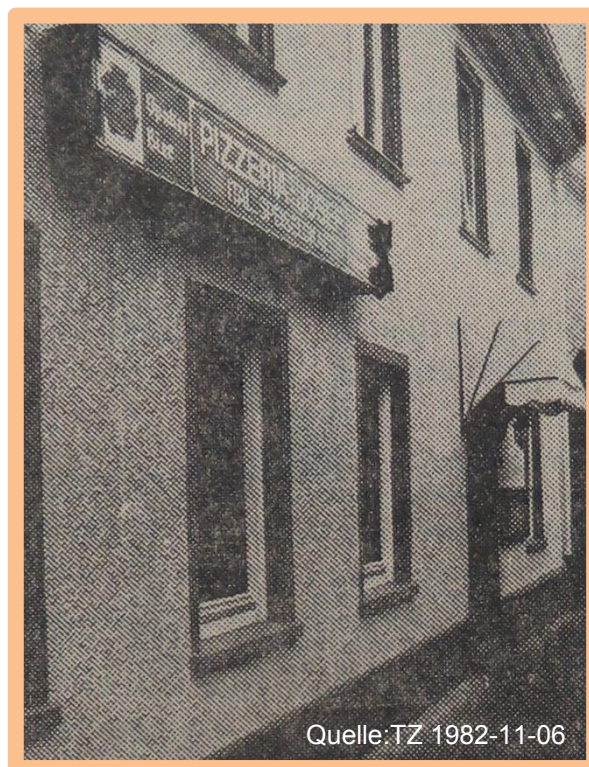
Pizzeria Josef mit Straßenverkauf