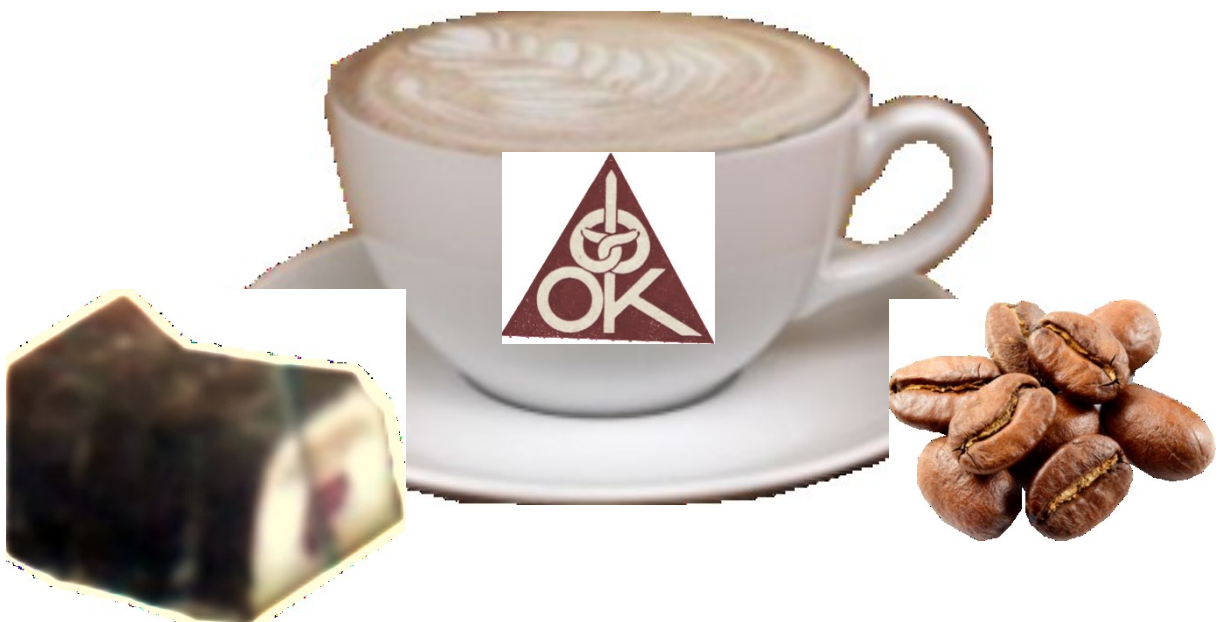
Infografik: H. Decher