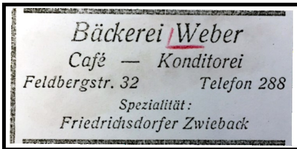
Bildmitte: Wilhelm Weber